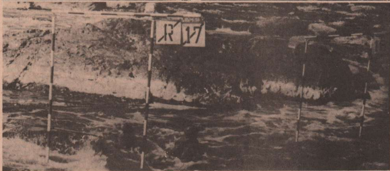
На порогах «Исети».