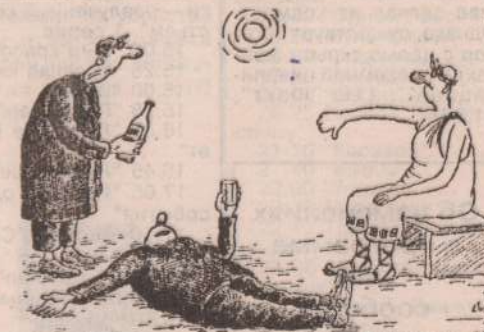
Рис. Н.КИНЧАРОВА (Волгоград).