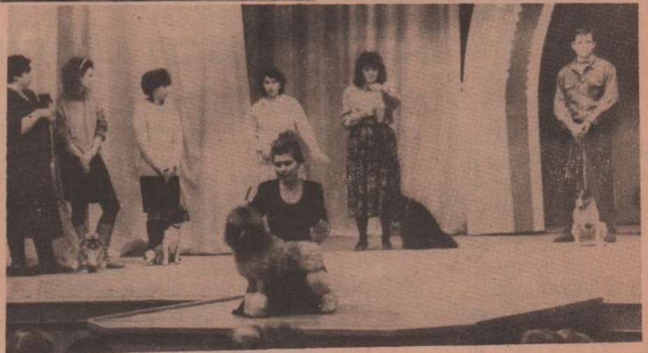
Посмотрите, какие они добрые! Посмотрите, в какой они форме!