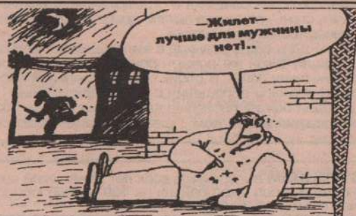
Рис. В. Шилова.

Галины достаточно расчетливые люди. Это неглупые матери, умеющие дружить со своими детьми, хотя они нередко от разных отцов - некоторые Галины неоднократно выходят замуж. В мужском обществе чувствуют себя значительно лучше, чем среди женщин, становятся кокетливыми и женственными, милыми и ласковыми. Среди подруг слыт женщинами с мужским характером, а вот мужей чаще всего выбирают бесхарактерных.