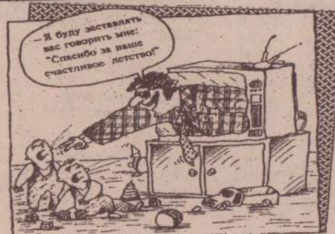
Рисунок А. Дорофеева.