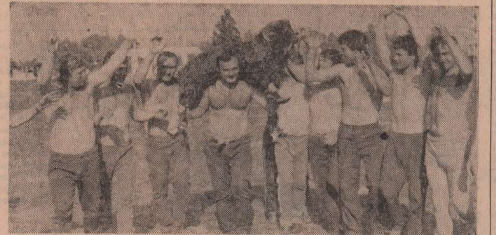
Молдавская ССР. Флорештский район — передовой в республике. Здесь живут и трудятся мастера высоких урожаев зерновых культур, садоводы. Их про-