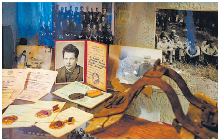
В маминском музее бережно сохраняют память о передовиках совхоза

территории – многие годы своей жизни. Ведь в советское время труд человека ценился, славился, и это наследие стоит перенять и передать подрастающему поколению.