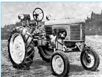
На таких тракторах ХТЗ работали в совхозе