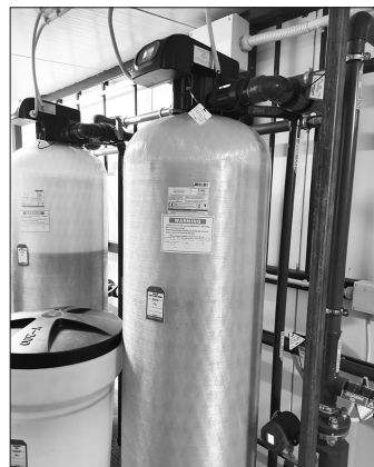
На новых станциях водоподготовки используются современные фильтры

В этом году аналогичную станцию водоподготовки в рамках нацпроекта «Жилье и городская среда» планируется поставить еще в одном населенном пункте Каменского городского округа – в Мартюше. На этот объект уже предусмотрено 116 млн руб. А в 2024 г. проект «Чистая вода» планируется реализовать в Сипавском и Травянском.