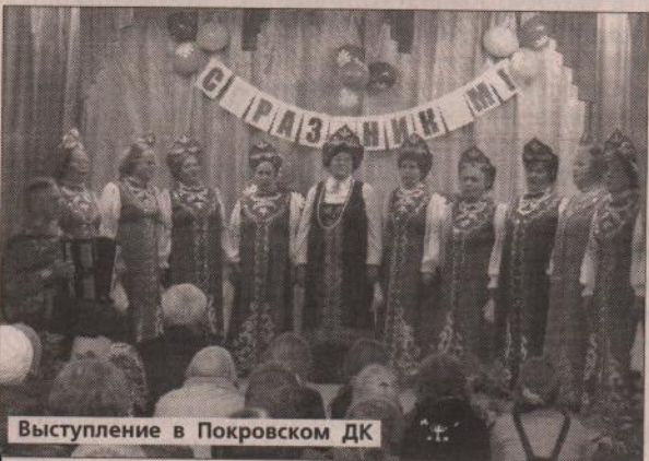
Выступление в Покровском ДК

В нашем районе также прошли торжественные мероприятия, посвященные людям элегантного возраста. Все было организовано так, чтобы пожилые люди ощутили дух праздника. Искренние поздравления, подарки от всей души, теплая атмосфера, концертные номера, непринужденное общение и, конечно же, праздничные застолья – все прошло в лучших традициях Каменского района.