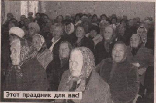
Этот праздник для вас!

На Среднем Урале проживают более 1 миллиона 200 тысяч пенсионеров, более 14 тысяч ветеранов Великой Отечественной войны, 160 тысяч тружеников тыла, более 358 тысяч ветеранов труда. Международный день пожилых людей – это повод еще раз обратиться пристальное внимание на старшее поколение, прислушаться к проблемам и нуждам людей третьего возраста, вспомнить о неосценимой значимости их опыта и труда. Празднование Дня пожилого человека в этом году приурочено к Году семьи и проводится Министерством соцзащиты под девизом: «Потенциал старшего поколения – во благо семьи».