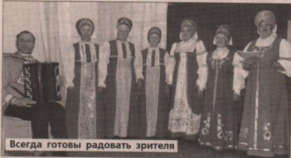
Всегда готовы радовать зрителя