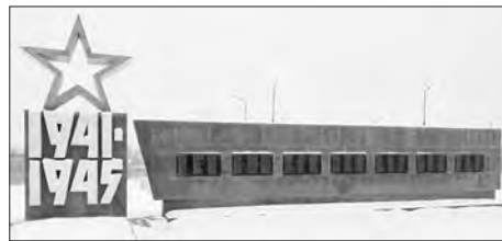
Парк Победы в Колчедане

* Завершено строительство парка Победы в Колчедане. Это комплексный объект, кроме восстановления обелиска воинам-односельчанам, павшим в Великой Отечественной войне, построены разные объекты, в том числе обелиск воинам-интернационалистам, зоны активного отдыха и детских игр. Открытие его будет приурочено к 75-летию Победы.