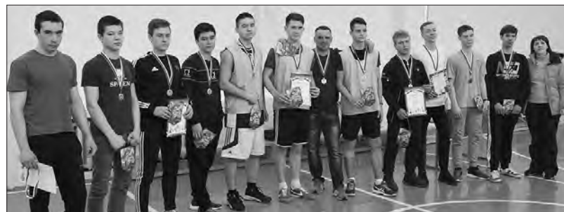
Участники районного конкурса «А ну-ка, парни!»