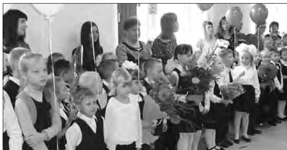
День знаний в новой школе в Покровском

* В День знаний в Покровском прошло торжественное открытие отремонтированной школы для учеников начальных классов, 80 учащихся сели в этот день за парты в новой школе.