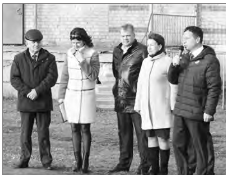
Открытие спортивной площадки в Мартюше