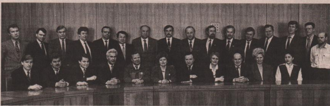
Свердловская областная Дума 1994-1996 гг. во главе с Э.Э.Росселем

Еще одна важная функция депутатов – определять через принимаемые законы стратегические пути развития Свердловской области. Следуя традициям предшественников, областные парламентарии сегодня прилагают все усилия, чтобы обеспечить законодательную базу дальнейшего развития нашей области.