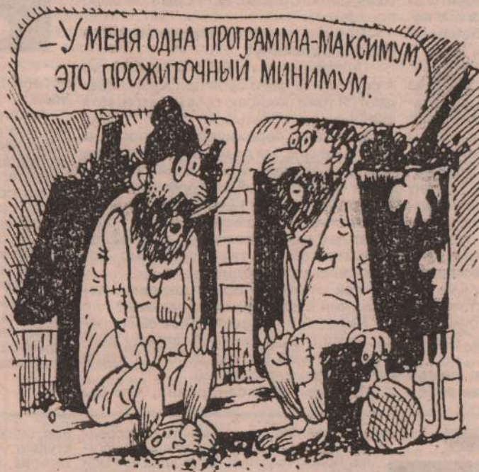
Рис. Л. ЧЕРНЫХ

Ну вот, очередной, стандартный безработный лихорадочно хватается за голову, пытается решить для себя воп-