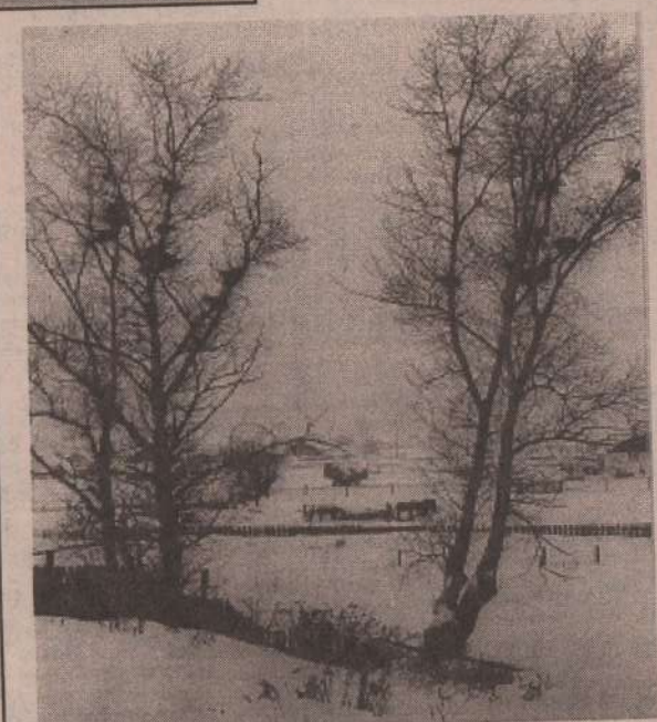
В ожидании хозяев.