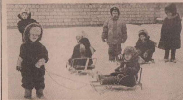
И мороз им не страшен