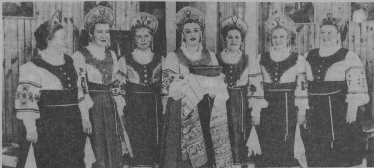
В минувшее воскресенье каменцы передали эстафету II Всесоюзного фестиваля народного творчества Белоярскому району. Рассказ о торжестве по случаю передачи эстафеты читайте на 4-й странице номера.