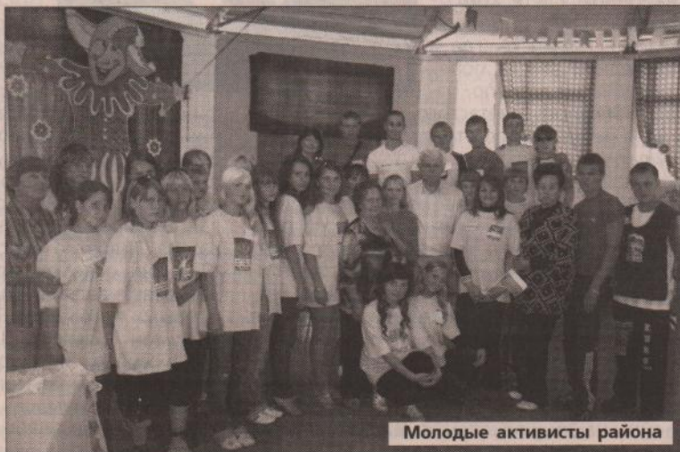
Молодые активисты района