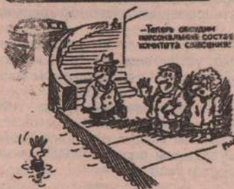
Рис. В. МИАЙЕРКО (г. Санкт-Петербург).