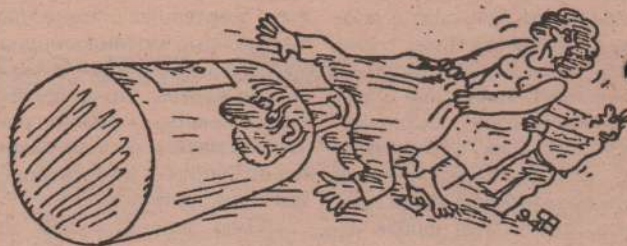
Рис. В. Федорова.