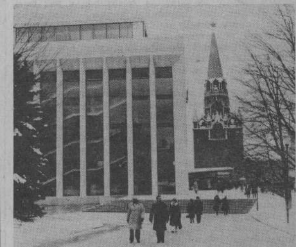
Москва. У Кремлевского Дворца съездов.