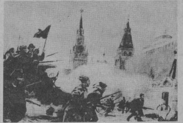
Картина художника Д. А. Шмаринова «Штурм Кремля».