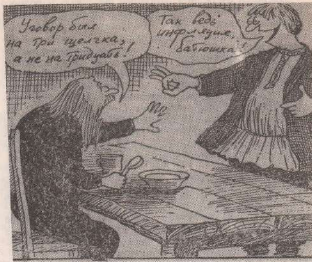
Рисунок В. Иванова.