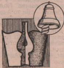
Редактор С. Трофимов