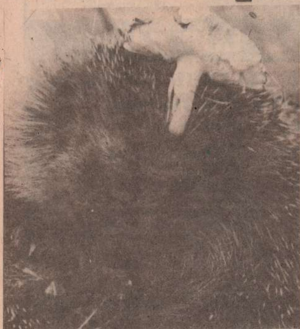
Заготовка грибов началась!