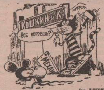
Рис. Л. ЧЕРНЫХ.