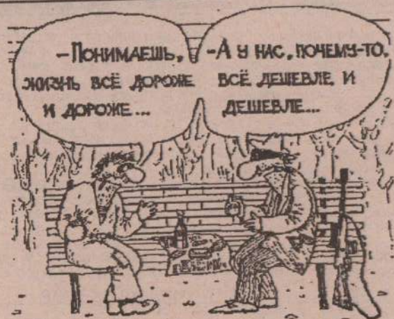
Рис. А. ЕВТУШЕНКО.