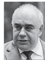
Аркадий Белявский, министр здравоохранения Свердловской области:

«Понимание, что необходимо выделять дополнительные средства на оказание нашим жителям высокотехнологичной медицинской помощи, есть. Прошу министерство здравоохранения готовить соглашение с министерством здравоохранения России на получение федеральной субсидии в полном объеме. Лимиты областного бюджета будут открыты».