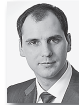
Денис Паслер, председатель правительства Свердловской области:

на софинансирование областных обязательств по оказанию жителям региона высокотехнологичной помощи. Это вторая по объему сумма после Москвы.