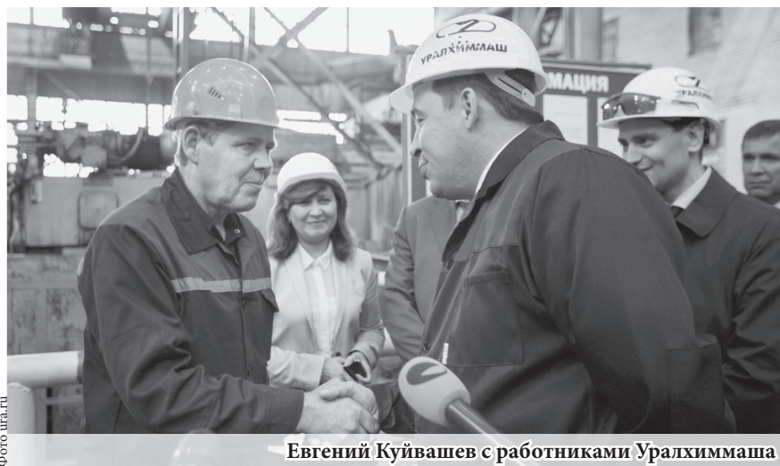
Евгений Куйвашев с работниками Уралхиммаша

С начала 2016 года индекс промышленного производства в Свердловской области вырос на 23,6 процента. Эти свежие статистические данные вновь подтверждают верность тезиса губернатора Евгения Куйвашева о том, что обрабатывающие производства являются локомотивом промышленности региона и основой роста экономики.