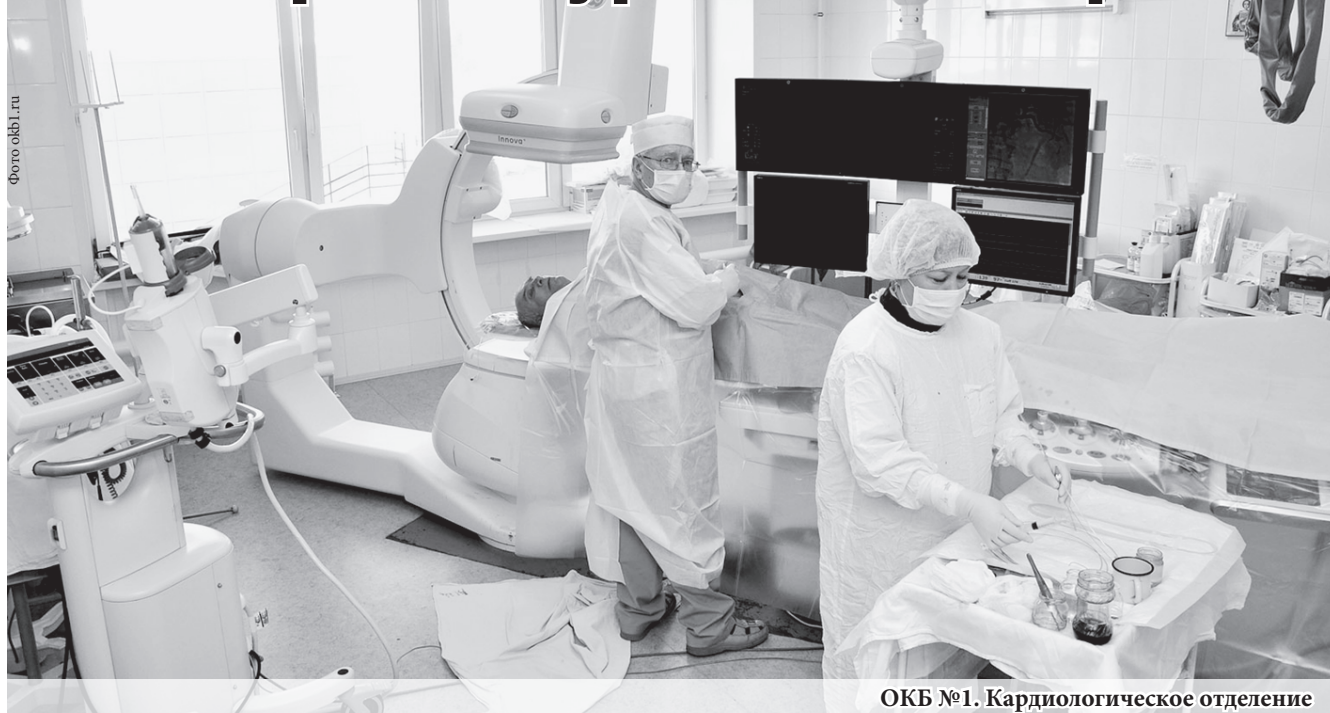
ОКБ №1. Кардиологическое отделение

Сегодня профессиональные интересы более 4 тысяч уральских врачей самых разных специальностей представляет НП «Медицинская палата Свердловской области».