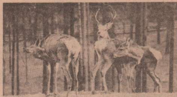
Неужели и эти животные пойдут на мясо?