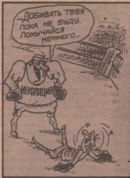
Рисунок В. Федорова.