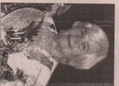
Благодарственные письма и денежные премии рования главка транспортного Награждена медалью «Ветеран труда». Уже на пенсию работала заведующей учебного хозяйства в Колчеданском профессиональном училище. Обшири трудовую стаж — 48 лет. Но и, находясь на заслуженном отдыхе, не сидит на месте, ее детище — это огород. Выложила сама печь, чтобы всегда можно было приготовить обед, похрюкала теплицу. Это в ее характере: если что задумает — обязательно сделает.

гой кормить по очереди малышей. Мы, старшие, тоже требовали внимания. Как успевала мама еще и обшивать нас всех, оставаясь загодой. В 1970 г. семья переехала в Колчедан. Родители устроились работать на Колчеданский завод ЖБК. В 1972 г. мама заканчивает вечернюю школу, в 1976 г. — Свердловский техникум транспортного строительства. На заводе прошла путь: бухгалтер, инженер-технолог, начальник цеха, главный технолог завода. В графе трудовой книжки «Сведения о поощрениях и награждениях» 48 записей. Это и денежные премирования за рационализаторские предложения, за активное участие в подготовке производства прогрессивных конструкций, за проявленную инициативу, высокие показатели в труде, за активную поддержку рождению внуков, помогаю воспитывать, их у нее семья торских предложений и др.