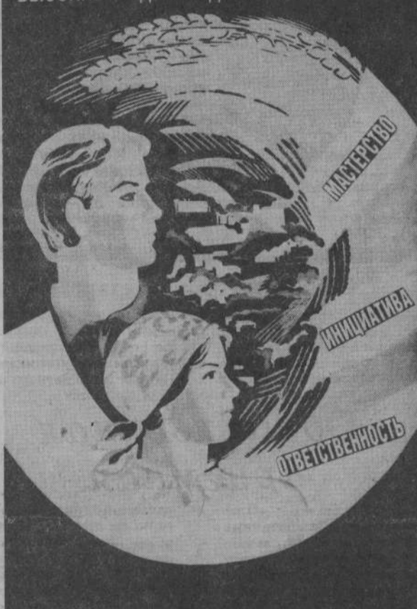
Плакат художника Н. Сахаровой. Издательство «Плакат».

РАБОТНИКИ АПК! 70-летию ВЕЛИКОГО ОКТЯБРЯ — ВЫСОКИЕ ТРУДОВЫЕ ДОСТИЖЕНИЯ!