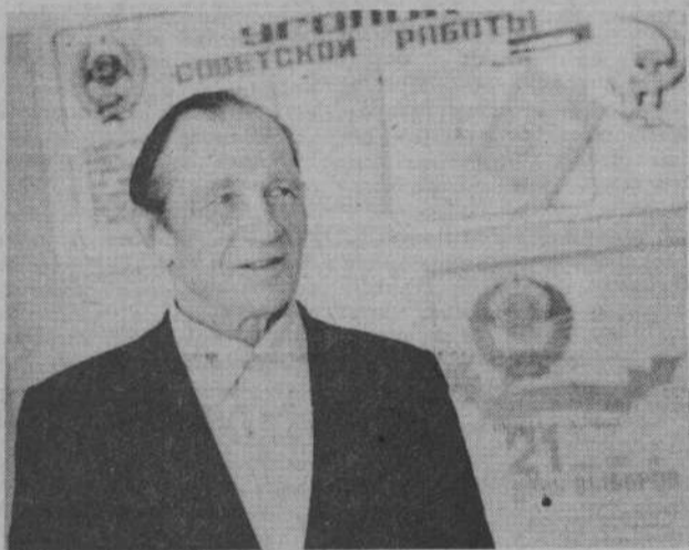
АКТИВИСТЫ ПРЕДВЫБОРНОЙ КАМПАНИИ