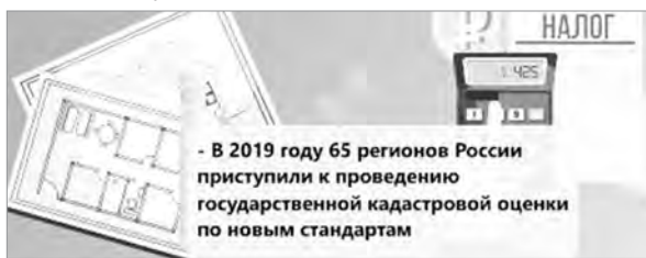
- В 2019 году 65 регионов России приступили к проведению государственной кадастровой оценки по новым стандартам

Напомним, в 2021 г. в рамках всероссийского перехода на исчисление налога на имущество с применением кадастровой стоимости свердловчане получат письма или уведомления о сумме налога, который им нужно будет заплатить до конца года.