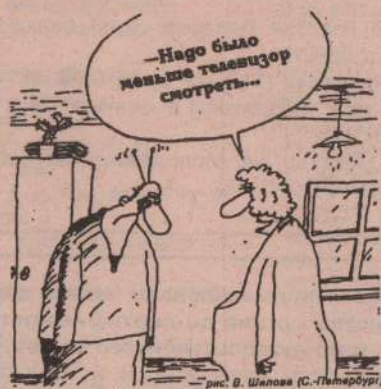
рис. В. Шолова (С.-Петербург).