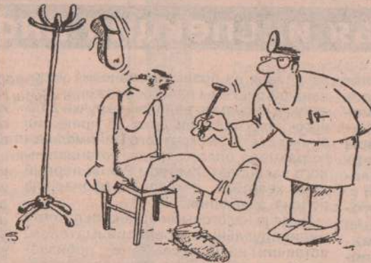
Рисунок Яцека Кавы (Польша)