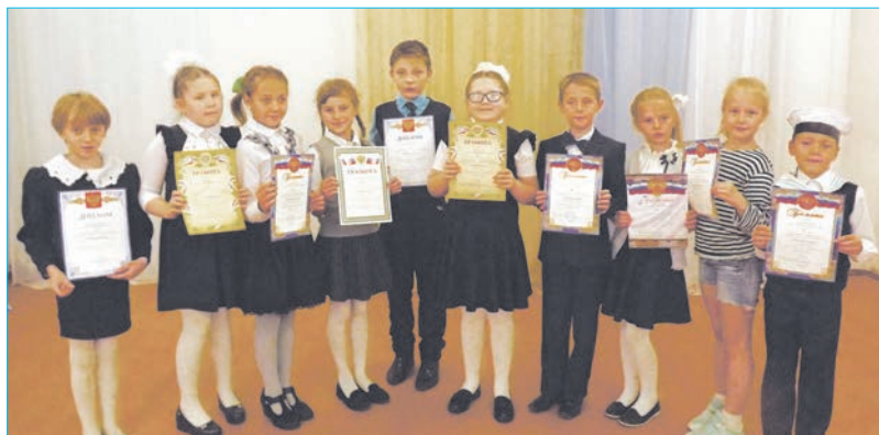
Участники конкурса художественного чтения «Читалочка»