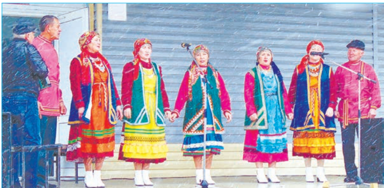
На ярмарке в Сосновском было весело

Вот и 14 октября в центре села шумела ярмарка. Торговые ряды расположились у ДК, среди них веселые скоморохи танцевали и создавали праздничное настроение.