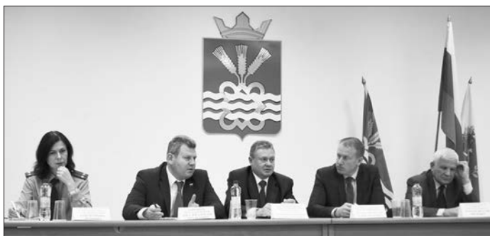
В диалоге профсоюзов с властью важно слышать друг друга

пенсионной реформы, в том числе и повышения пенсионного возраста граждан РФ.