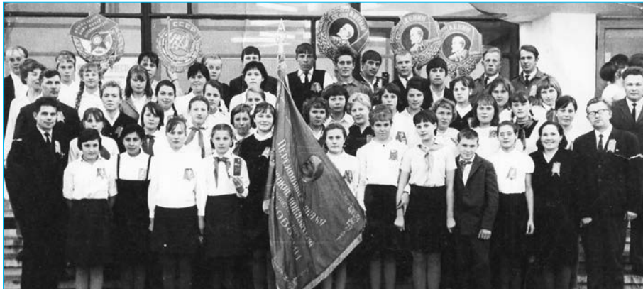
1968 г. Вручение переходящего Красного знамени комсомольцам из Травянского

В комсомольской организации совхоза «Травянский» в 1968 г. насчитывалось 150 человек, это были передовые рабочие, служащие и учащиеся совхоза в возрасте до 28 лет. В честь 50-летия ВЛКСМ нашей передовой комсомольской организации было вручено переходящее