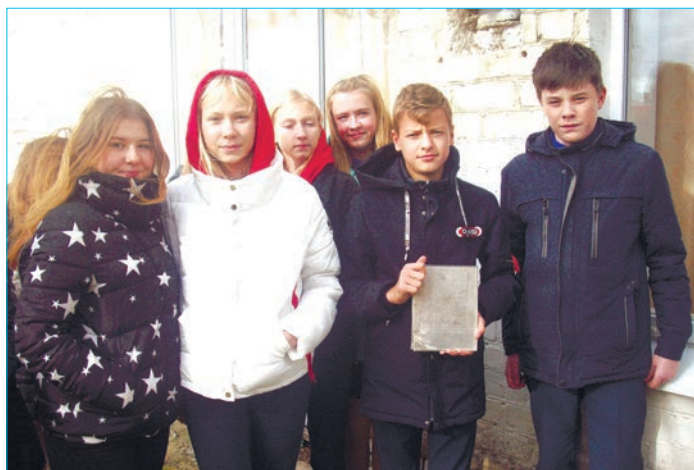
В руках у ребят из Пироговской школы «Капсула времени»

школой жизни для многих поколений советских людей; организация, внесшая огромный вклад в героическую историю нашей страны. Комсомольский пример беззаветного служения Родине всегда будет в памяти нынешних и будущих поколений.