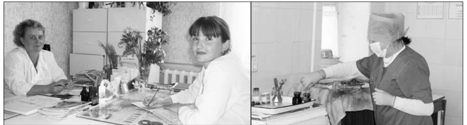
Рабочие будни Каменской ЦРБ

В 2008 г. в ЦРБ запущен новый корпус общей площадью более 2500 кв. м, стоимостью 78 млн. руб., в который закуплено оборудование на 12 млн. руб. Строительство его финансировалось из средств федеральной программы преодоления последствий Восточно-Уральского радиоактивного следа, в зоне которого находится Каменский район. Сейчас в 65-ти его населенных пунктах проживает около 30 тыс. человек.