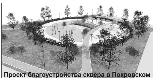
Проект благоустройства сквера в Покровском