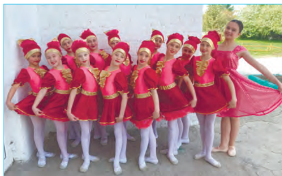
Постановки ансамбля «Спектр» – украшение концертных программ