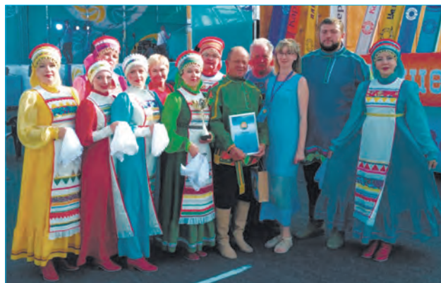
Ансамбль «Росиночка» знают далеко за пределами Мартюша