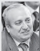
Франц Клинецвич, депутат Госдумы России:

«Сегодня мир перевернулся с ног на голову. Важно, чтобы настоящие истины, построенные на аргументации, исторических фактах, здравом смысле и жизненном опыте, были донесены до нашей молодежи. Упустив этот момент, мы потеряем страну. Знаю, что центр патриотизма находится здесь, на Урале. Отсюда, из этого оплота нашей державы мы будем черпать истоки безграничного патриотизма, который распространится на всю Россию».