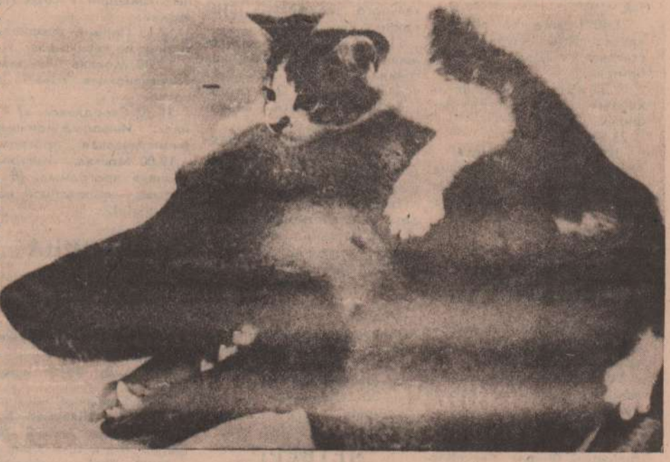
Вместо шапки на ходу он надел...

Если гостей много и стол раздвинут, следует все виды закусок продублировать. Продукты не должны «захламлять» борта блюд и тарелок. Посуда не должна полескаться, петрушка. И, конечно же, ностью закрывать скатерть: белые просветы хорошо дополняют цветовую гамму стола. Обязательны салфетки, тканевые или бумажные. Но, конечно же, главным украшением стола будут со вкусом украшенные и приготовленные самой хозяйкой яства. Ореховый торт с шоколадным кремом. Желтки яиц разотрите с сахаром и постепенно добавляйте к ним толченые орехи, сухари, кофе или какао, лимонную цедру и сок, затем взбитые в пену белки. Эту смесь вылейте в хорошо смазанную и посыпанную мукой форму для торта и выпекайте на среднем огне. Для крема масло разотрите в пену и добавьте сахар, желтки, шоколад, кофе, ром. Готовый торт разрежьте. Нижнюю часть обильно смажьте кремом. Им же украсьте торт сверху и смажьте по бокам. Тесто: 6 яиц, 6 ст. ложек сахарного песка, 9 ст. ложек толченых орехов, 1 ст. ложка сухарей, немного какао или 1/2 ст. ложки кофе, сок и цедра от 1/2 лимона. Крем: 125 г масла, 3 ст. ложки сахарного песка, 2 желтка, 100 г растопленного в 2 ст. ложках молока шоколада, 1/2 ст. ложки кофе, 1 ч. ложка рома.