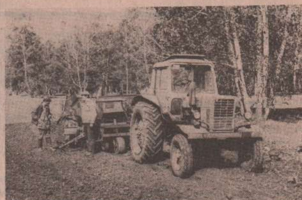
На снимках: механизатор В. Д. Воробьев; Г. В. Третьяк на посадке картофеля; школьники Шафиковы - Саша с Натальей.