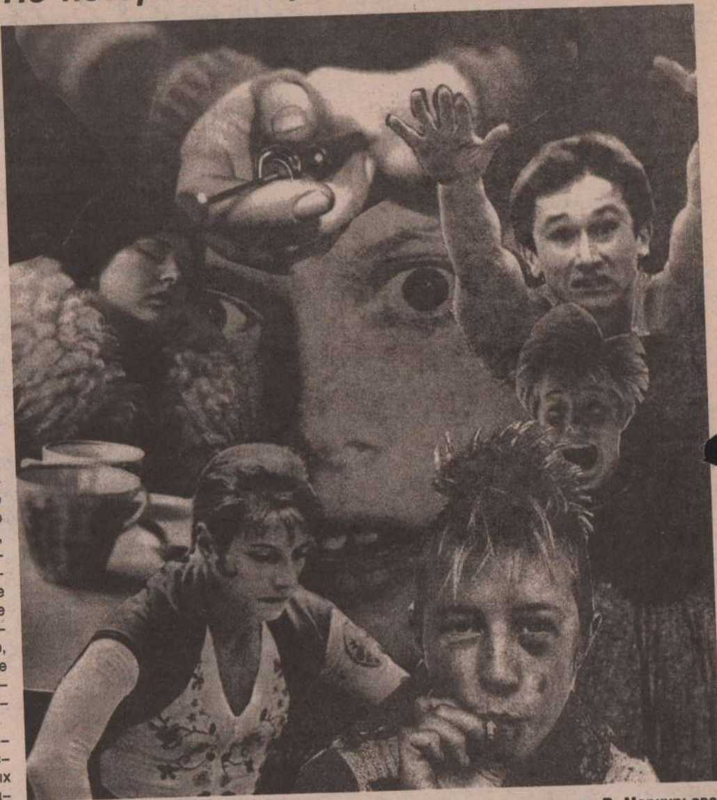
Фотоколлаж В. Меркурьева.

Надо немедленно принять необходимые меры, меры быстрого реагирования на каждый сигнал, факт, попытку применения и распространения наркотиков. Здесь стоит объединить усилия с горожанами.