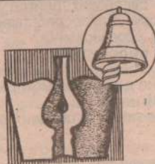
Редактор С. Трофимов

Подписка закончилась. Подписка продолжается. Газету можно выписать, начиная с сентября.