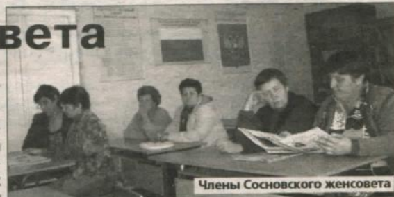
Члены Сосновского женсовета