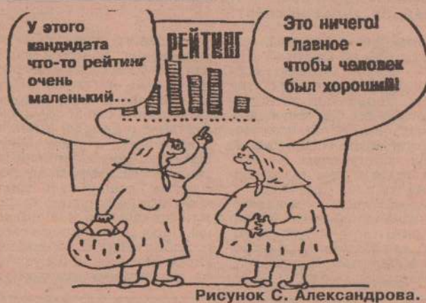
Рисунок С. Александрова.