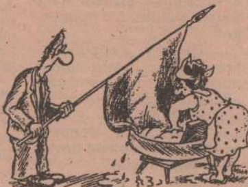
Рис. В. МИЛЕЙКО.