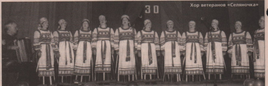
Хор ветеранов «Селяночка»

Восемь лет женщины-ветераны посещают хор «Селяночка». На своей сцене они желанные гости, но им бы хотелось показать свое мастерство и в других селах. В марте они выступали в п. Мартуше, д. Броду и были очень довольны этими поездками. Хотели бы выезжать чаще, но все упирается в отсутствие транспорта.