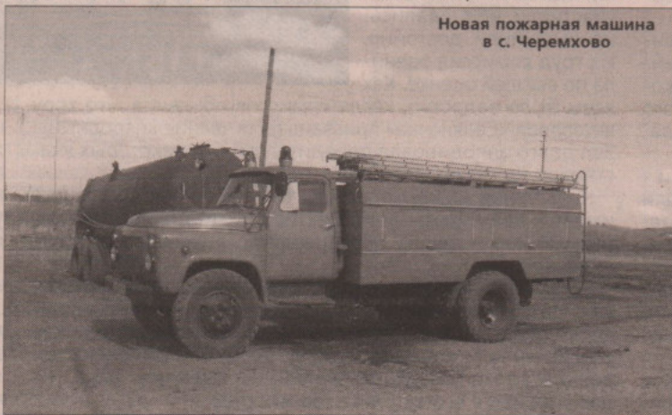
Новая пожарная машина в с. Черемхово

Весенний период работники пожарной службы считают горячей порой. Пользуясь теплой погодой, жители города и района выходят на природу отдыхать, разжигают костры и оставляют их незатухшими. Из-за этого горят леса, поля. Специалисты противопожарной службы говорят, что необходимо хотя бы скашивать края полей. Селянам, дачникам нельзя жечь сухую траву и мусор рядом с домами. Всем нам нужно быть внимательными, ведь когда огонь находится под наблюдением, он не столь опасен, а вырвавшись из-под контроля, приносит беду.