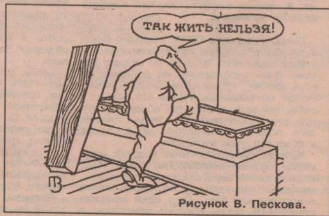
Рисунок В. Пескова.