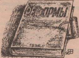
Рисунок В. Федорова.

Как сообщил начальник полиции А. Н. Городницкий, ими доначислено более 29 млрд. рублей. Часть этих денег взыскана, в том числе «живым» рублем.