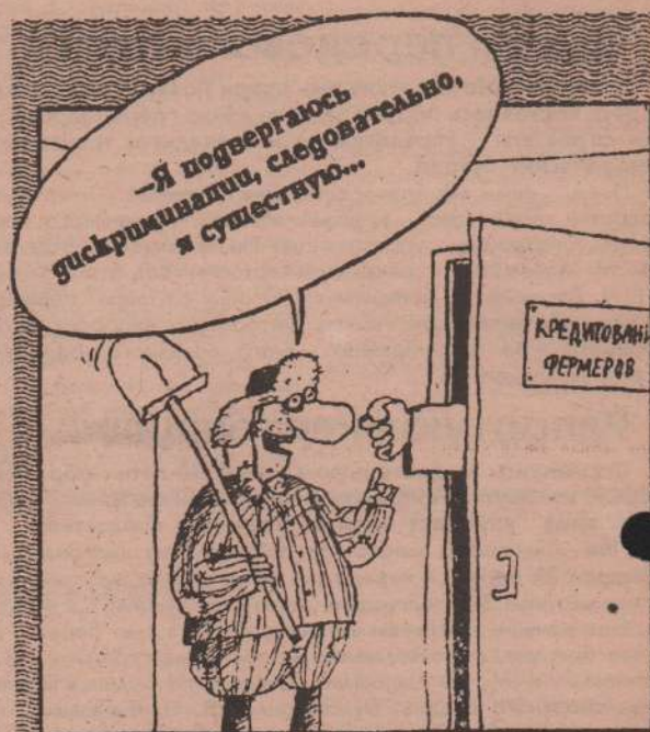
Рис. В. ШИЛОВА (г. Санкт-Петербург)