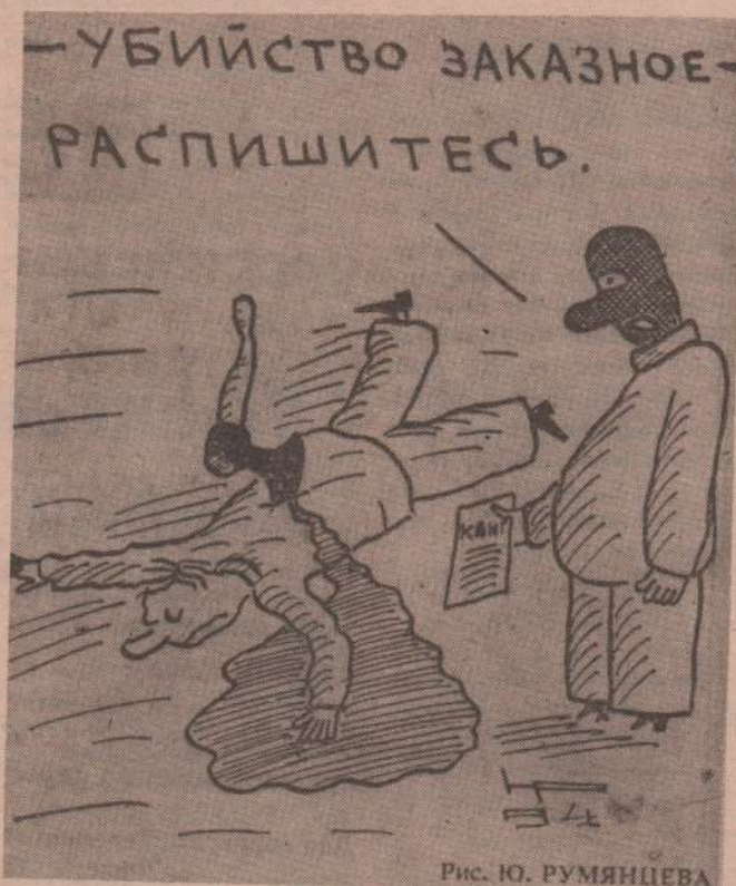
Рис. Ю. РУМЯНЦЕВА

Представьте, стоит пацан, смотрит на доску. Вот для не-