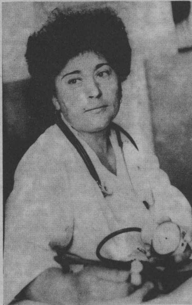
БЕЛЫЙ — ЦВЕТ МИЛОСЕРДИЯ

Причиной низкого качества молока в совхозе является (и тут у зоотехников и экономистов нет разногласий) недостаточная работа по охлаждению молока. Восемь холодильных установок не хватает. К тому же они часто выходят из строя. Но причина не только в этом. Отсутствие надлежащего контроля за санитарным состоянием на фермах — тоже одна из причин. Теперь все сваливают на холодильные установки, заявляя, что вот зимой, когда в холодильниках не было большой надобности, молоко шло первым сортом. Это не совсем так. Вспомним март. Нынче он мало чем отличался от февраля, но именно в этот месяц было сдано рекордное в совхозе количество второсортного молока — 530 центне-