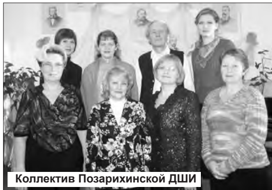
Коллектив Позарихинской ДШИ