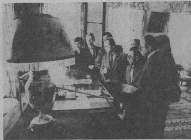
Посетители у рабочего стола В. И. Ленина в Большом доме, в Горках.

КОЛЛЕКТИВ Синарского ремонтного завода сам себе снизил план годового объема производства на миллион рублей. Это было сделано после тщательного взвешивания всех «за» и «против». Корректировка плана позволила полностью удовлетворять заявки совхозов на ремонт техники, потому что больше стали обращать внимания