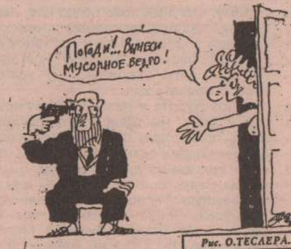
Рис. О. ТЕСАЕРА.